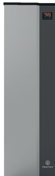
160 L - 200L - 260L - 500L