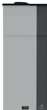
100L - 130L